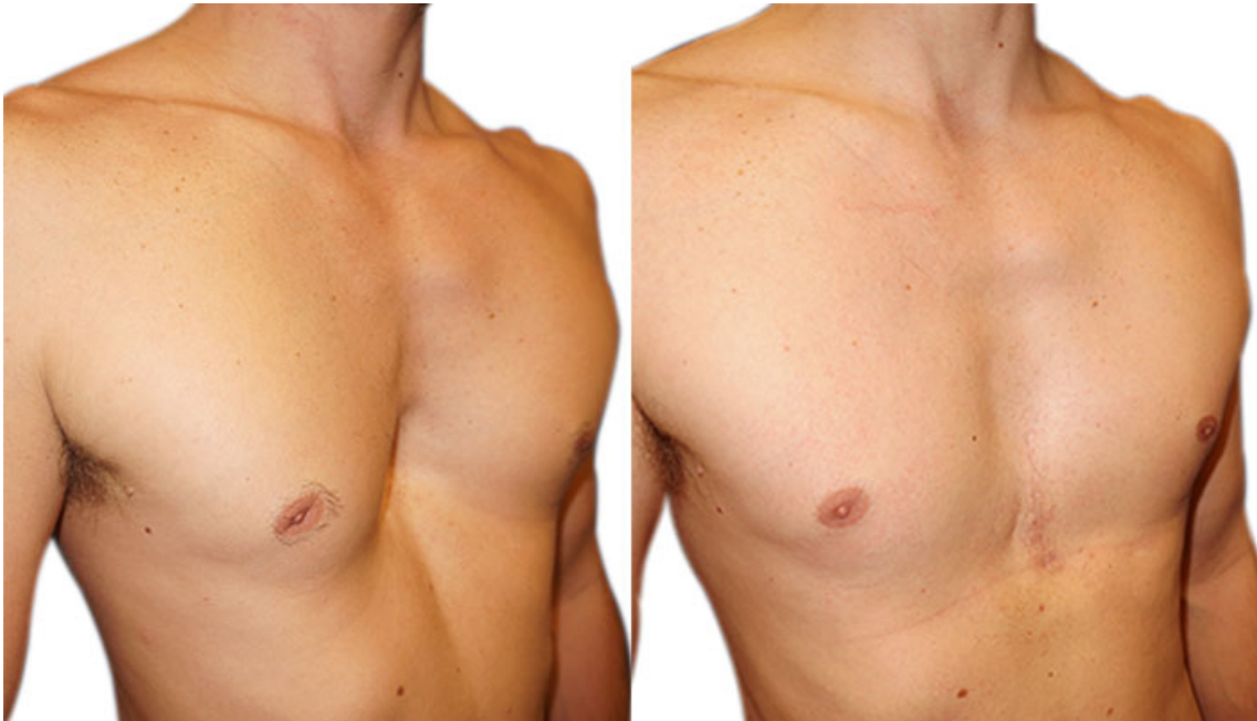
Antes / después de la cirugía en un hombre

La corrección de la deformación es en la gran mayoría de los casos, total, definitiva y natural, con una restauración anatómica muy satisfactoria.