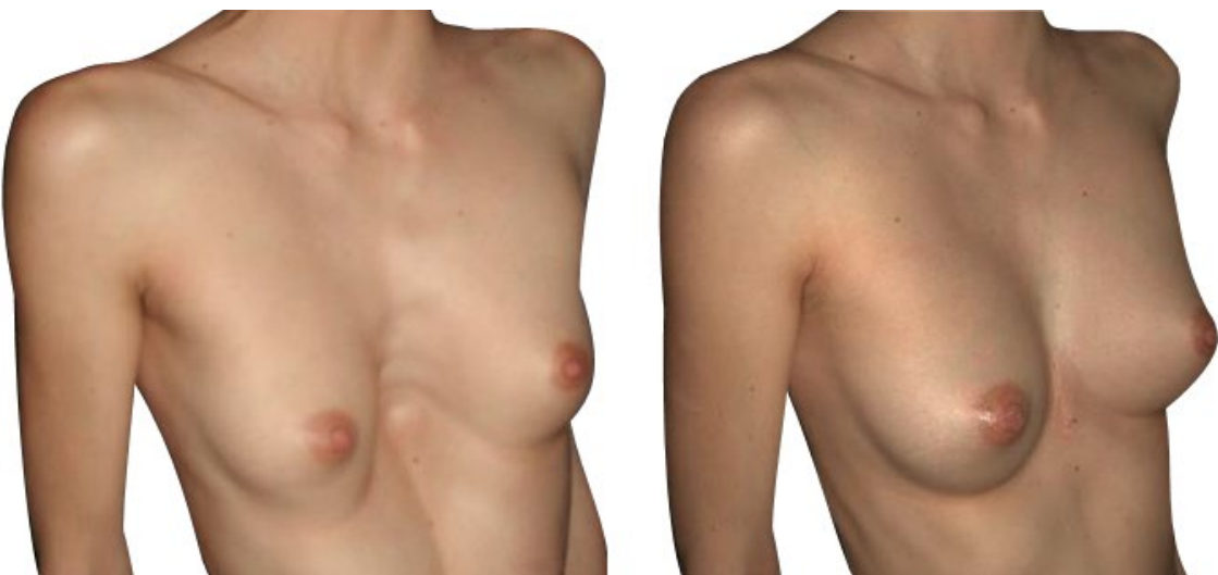
Antes / después de la cirugía en una mujer