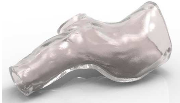
Image implant correspondant